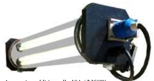
Avec prise additionnelle 10A / 2300W

Autres modèles et présentations : nous consulter