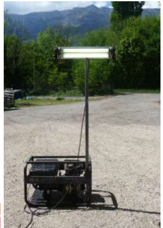
Monté sur mat avec générateur (optionnel)