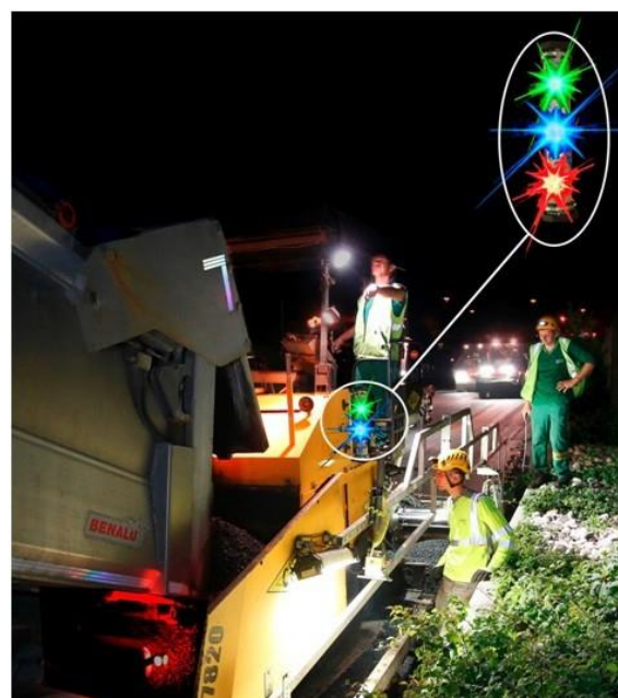
Finisseur équipé d'une paire de TriLED

Autres modèles ou finitions : nous consulter